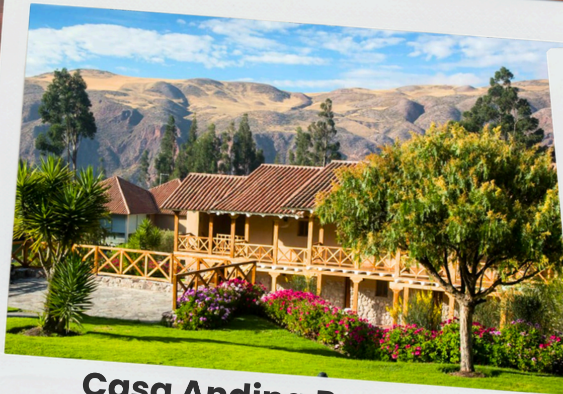
Casa Andina Premium Valle Sagrado